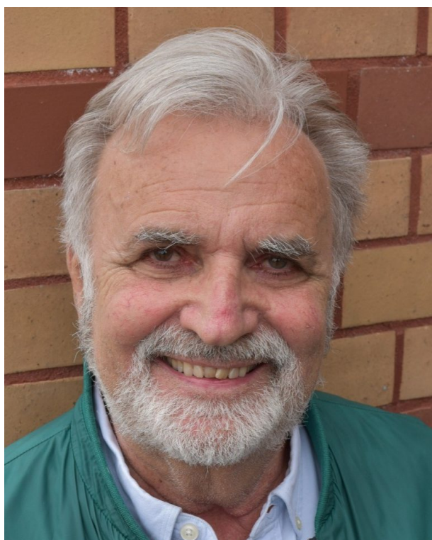
(c) privat 06/21